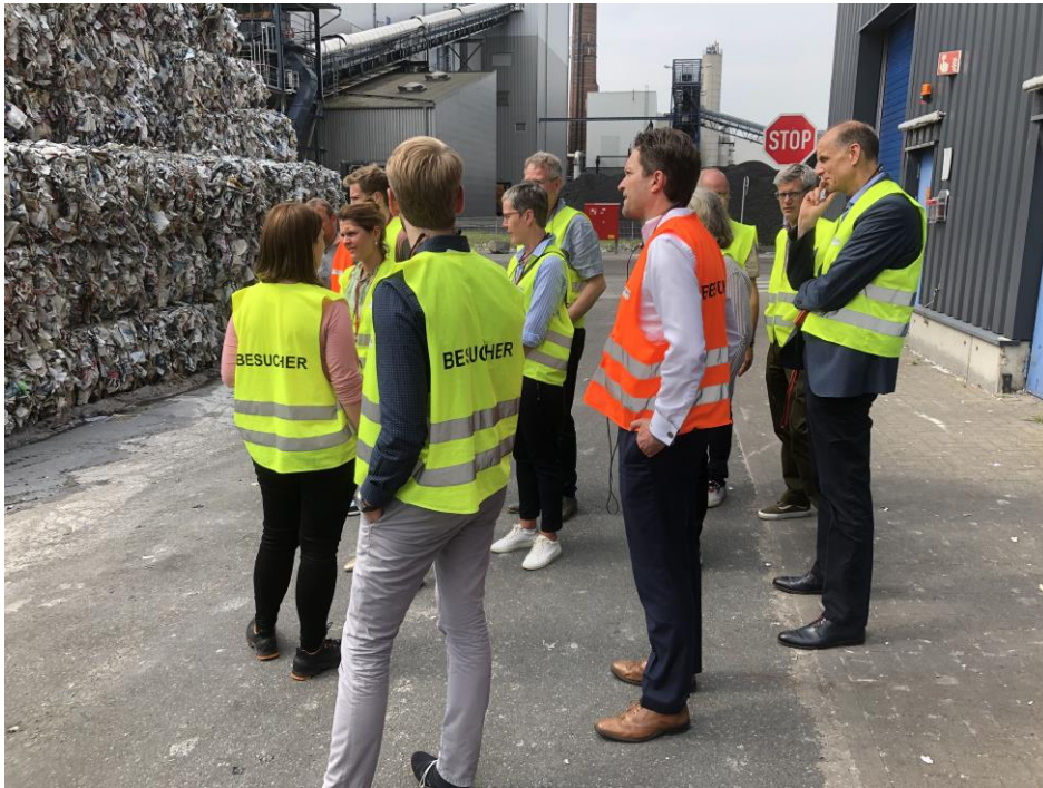
Bild 2: Auf einer Betriebsführung bei der Steinbeis Papier GmbH erhielten die Arbeitgeber der Region einen Einblick in das nachhaltige Wirtschaften am Standort Glückstadt.

UNTERNEHMENSVERBAND UNTERELBE-WESTKÜSTE E.V.