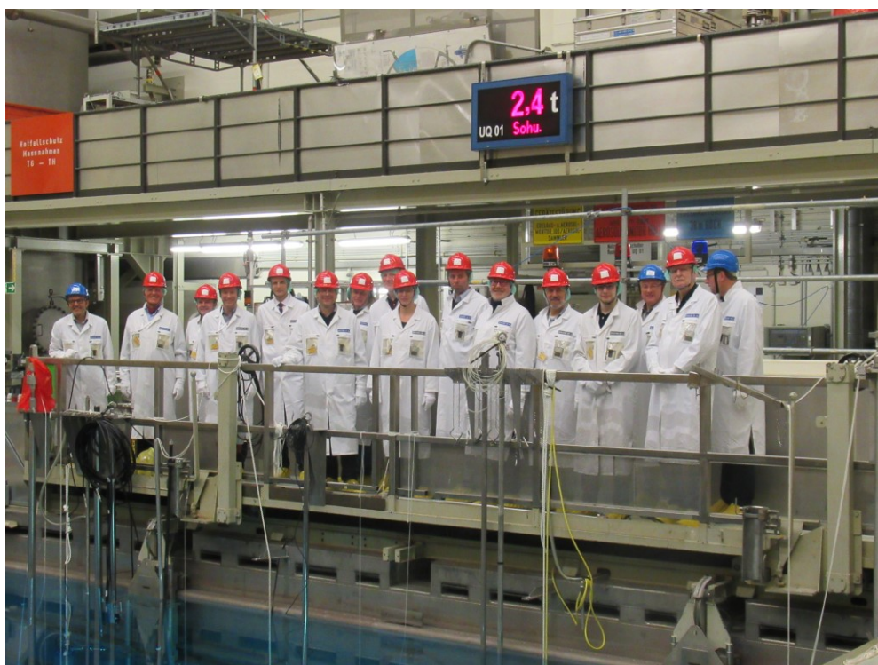
Mitglieder des UVUW bei der Besichtigung des Kernkraftwerks Brunsbüttel

Der UVUW ist ein Zusammenschluss von knapp 400 Unternehmen im Gebiet von Norderstedt bis zur dänischen Grenze. Gegründet wurde er vor 73 Jahren und hat sich zu einem wichtigen Sprachrohr der Wirtschaft an der Westküste und im Hamburger Umland entwickelt.