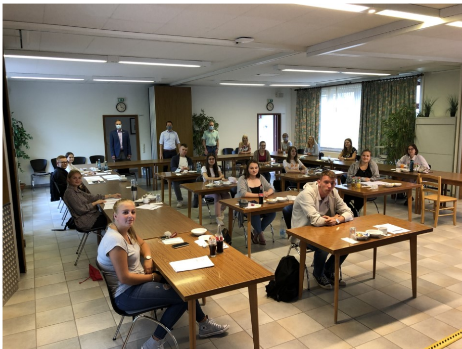
Schülerinnen und Schüler des RBZ während des Planspiels WIWAG bei Holcim (Deutschland) GmbH